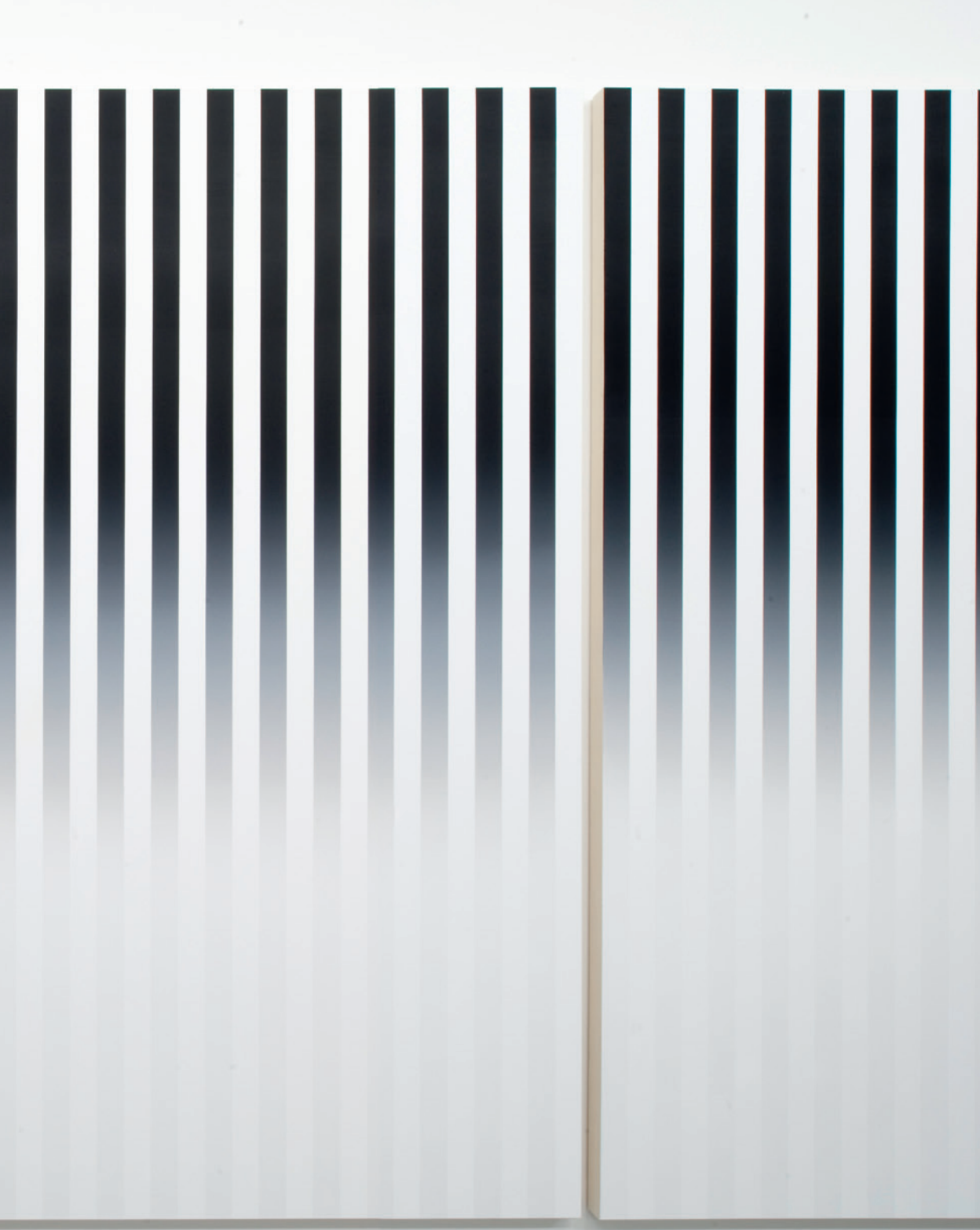
Slow Motion , 2011 Acrylique sur toile / Acrylic on canvas. Exposition / Exhibition, Anisotropy , Le Plateau-Frac Île-de-France.