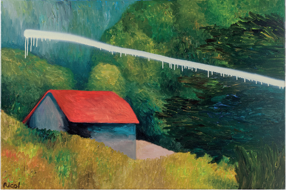
Sabot d'âge IV , 2009 Acrilique et peinture à la bombe sur toile, 80 x 120 cm. Acrylic and spray paint on canvas, 31,5 x 47,3 in.