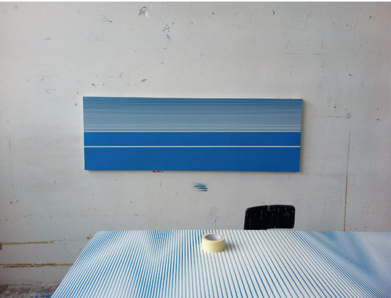
Vue de l'atelier de Philippe Decrauzat, œuvre en cours / View of Philippe Decrauzat's studio, work in progress