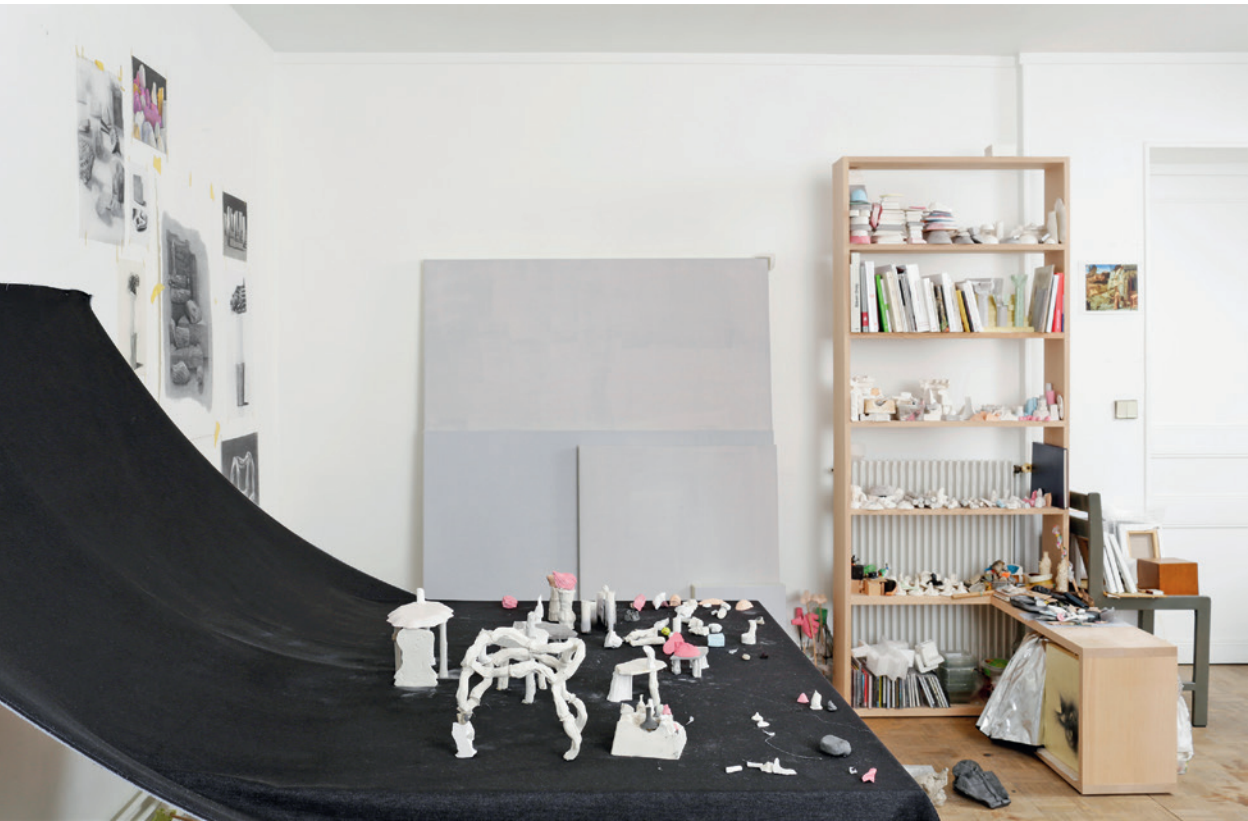
Vue de l'atelier de Maude Maris / View of Maude Maris' studio