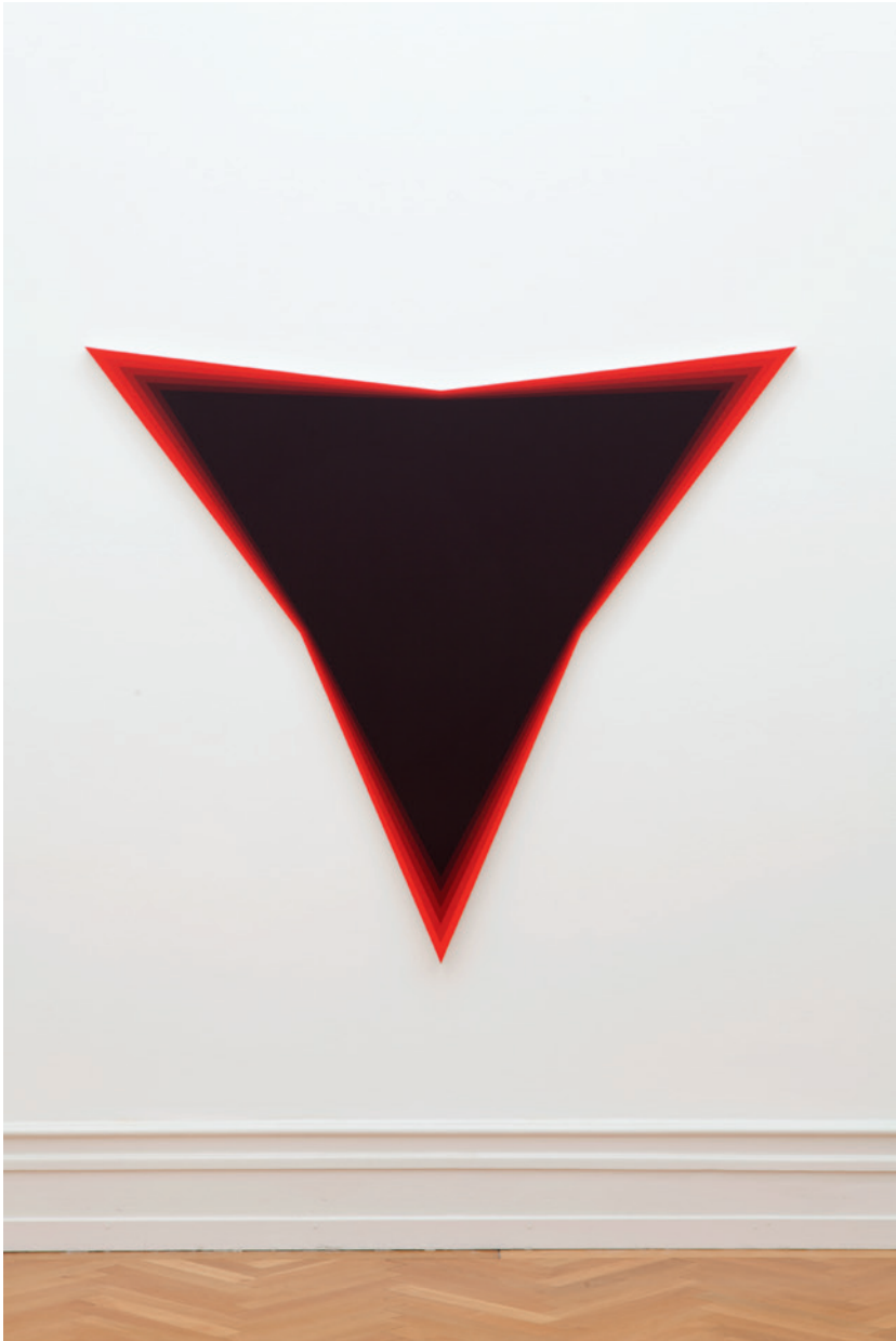
Anti-Illusion , 2012 Acrylique sur toile, 220 x 200 cm. Acrylic on canvas, 86,6 x 78,7 in.