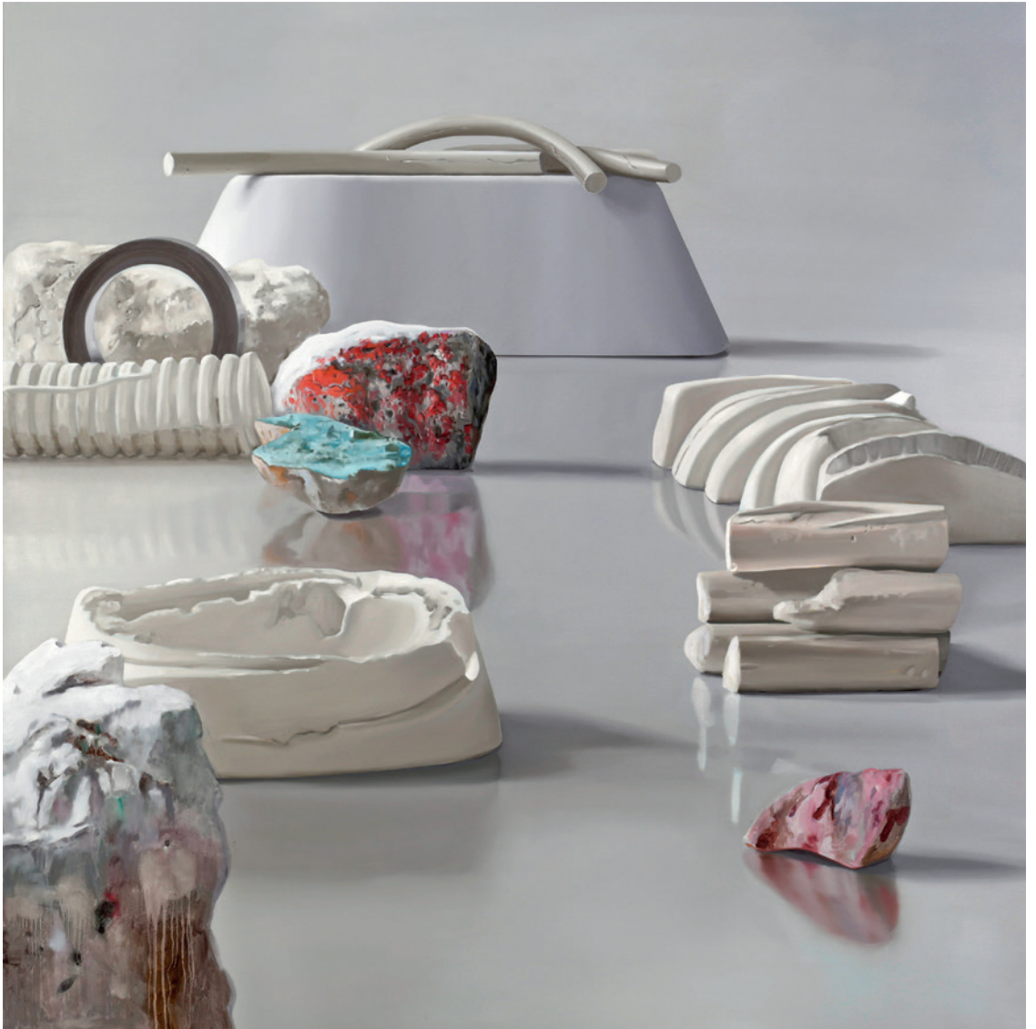
Faire fausse route , 2014 Huile sur toile, 150 x 150 cm. Oil on canvas, 59 x 59 in.