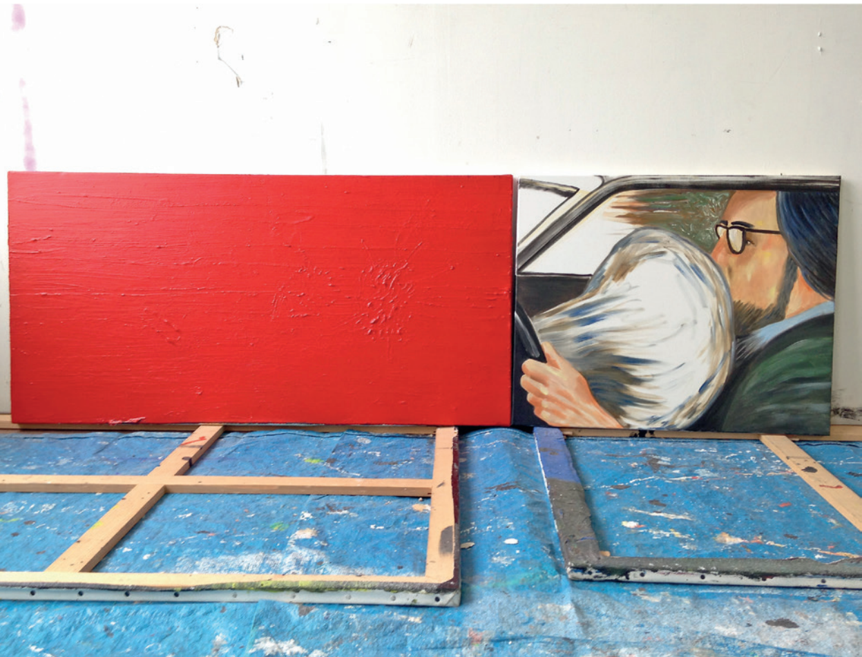
Vue de l'atelier de Raphaëlle Ricol / View of Raphaëlle Ricol's studio